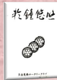
創立 30 周年記念誌